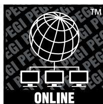
Logo PEGI Online