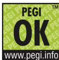
Logo PEGI OK

Ikona PEGI Online jest umieszczana na opakowaniach gier lub w samej witrynie internetowej. Logo wskazuje, czy w dany tytuł można grać w sieci i czy produkt lub witryna jest kontrolowana przez operatora dbającego o ochronę młodzieży. Ikonę PEGI Online mogą umieszczać firmy, które wykazały, że w swoich działaniach kierują się zasadami określonymi w Kodeksie bezpieczeństwa PEGI Online – m.in. sprawdzają, czy ich strony nie zawierają treści niezgodnych z prawem lub nieadekwatnych do wieku osób z nich korzystających, dbają o ochronę danych osobowych użytkowników, podają rzetelne informacje na temat treści gier itp.